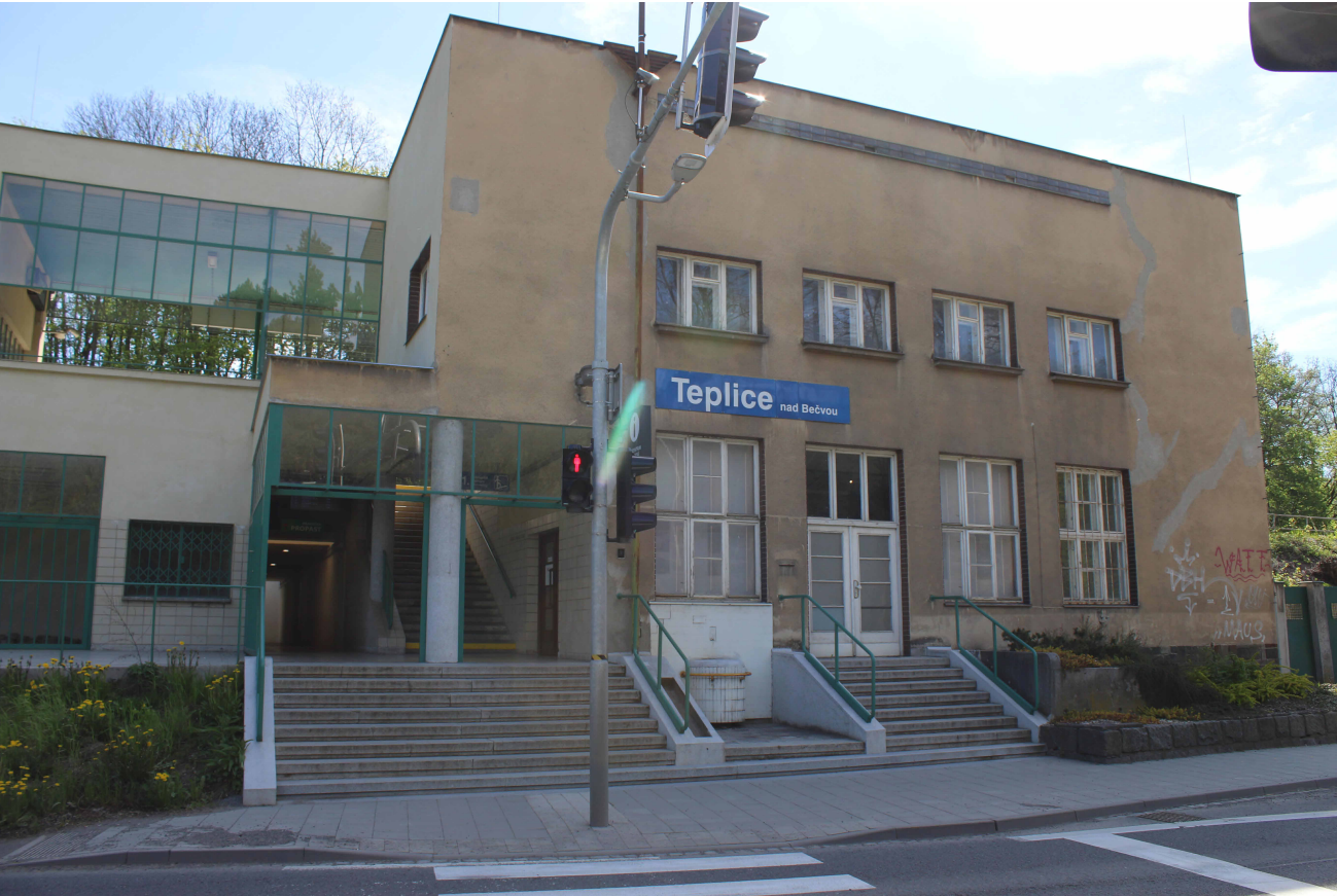
STÁVAJÍCÍ POHLED NA PŘECHOD PRO CHODCE Z VÝCHODNÍ STRANY