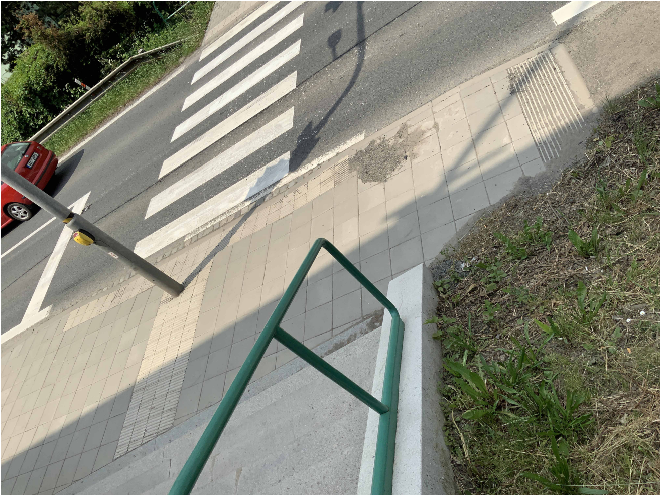
STÁVAJÍCÍ POHLED NA PŘECHOD PRO CHODCE Z VÝCHODNÍ STRANY